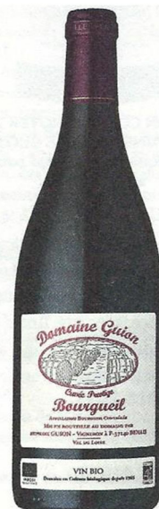
BOURGUEIL CUVÉE PRESTIGE 2016 DU DOMAINE STÉPHANE GUION. Un cabernet franc plein de vitalité.